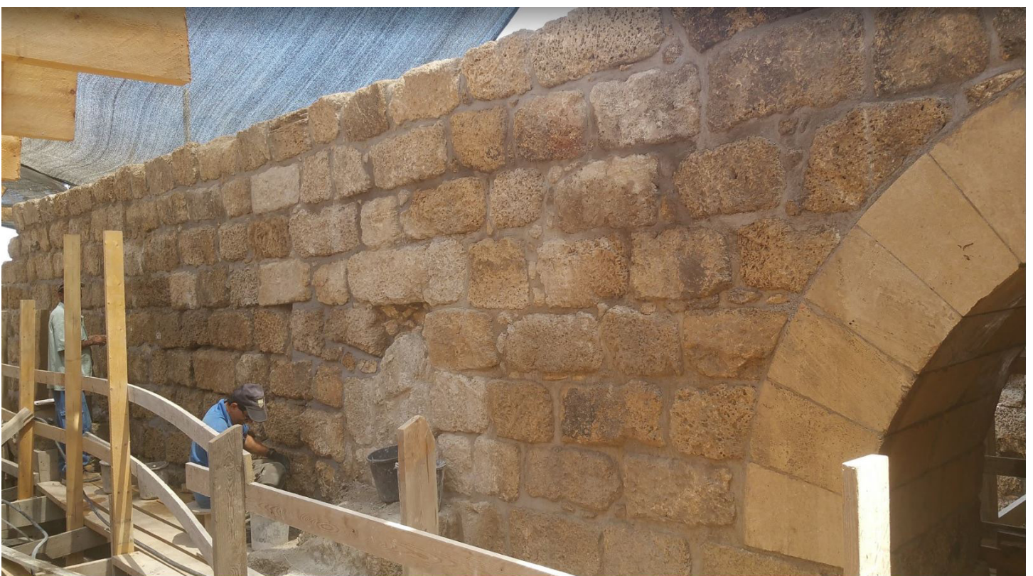
למעלה, בנייה מחדש של אומנה. צילום: רענן כסלו; למטה, ייצוב הקיר באמצעות יישום חומר מליטה במישקים. צילום: יורם סעד