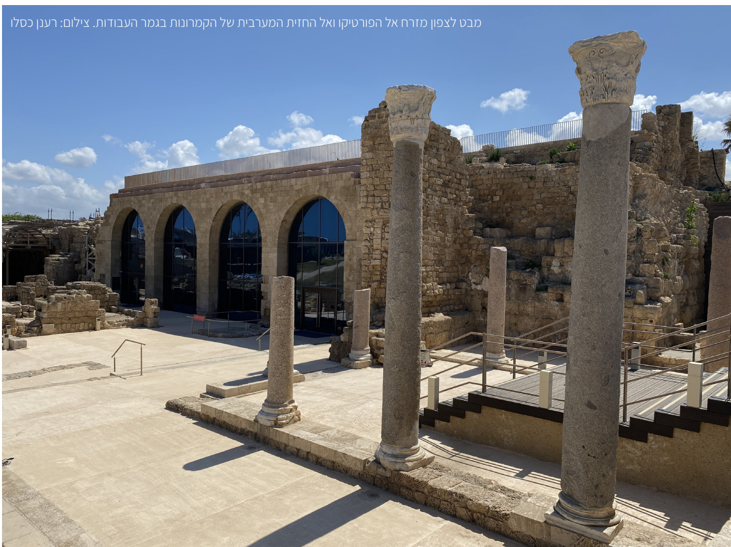
מבט לצפון מזרח אל הפורטיקו ואל החזית המערבית של הקמרונות בגמר העבודות.

שיקום ארבעת הקמרונות הדרומיים במתחם קמרונות הנמל בקיסריה נעשה בטכנולוגיות בנייה עתיקות ועכשוויות וביצעו אותו צוותי השימור המקצועיים של רשות העתיקות במשך כארבע שנים. פרויקט מורכב ורב־תחומי זה מחיה את השרידים הארכיאולוגיים ומעשיר את חוויית המבקר באתר. מרכז המבקרים שנחנך במאי 2019 מעניק למבקר חוויה המציגה חלל קמרונות מהתקופה הרומית הקדומה. חוויה זו מתארת את סיפורה של קיסריה.