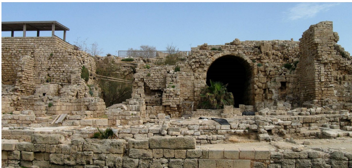
מבט אל החזית המערבית של הקמרון לפני השיקום.